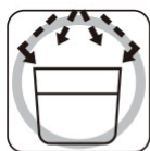
電子レンジ オーブン可 For Microwave, Microwaveoven Use